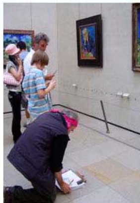
圖22：奧塞美術館裡描畫的大嬸

試問假若今天你看到梵谷親筆畫作時，有何想法？或是到台北正在展出的「燃燒的靈魂—梵谷」特展遇見梵谷，又是怎樣的心情？曠世鉅作可能也要遇見伯樂吧！在奧塞美術館的梵谷展區，我遇見這樣一幅美麗動人的畫面(圖22)，一位大嬸半蹲半跪的姿態，正看著梵谷<奧維教堂>的畫作，全神貫注的描摹著，無論大嬸出自怎樣的心情，但是她的舉動，足以說明法國為何是以文化藝術立國的國家，也說明了梵谷在法國遇見對的人、對的政策，使燃燒生命的梵谷精神不死。很明顯的，梵谷的這種感染力，在法國至今還不斷的持續著呢！