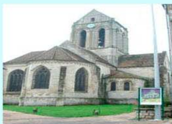
圖10：奧維教堂與立牌

小道(圖12)，來到經常作畫的麥田，或許沉思許久，或許對於人生作了最後告白，或許什麼也沒多想，在麥草堆中舉槍自盡。(圖13)梵谷逝後被安葬在奧維的墓園，他摯愛的弟弟西奧，六個月後也追隨哥哥心碎死去，原本西奧被葬在荷蘭，後來西