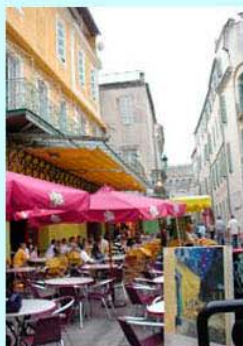
圖3：白天的〈夜間咖啡館〉場景

雖說梵谷足跡之旅，阿爾小鎮採用約十幅梵谷畫作的景點，但礙於版面，本文僅以幾幅作品舉例說明。首先來到梵谷在阿爾落腳居住的地方，〈黃色小屋〉見圖2，圖版的畫面比對實景，畫面中的小屋已不見了，只剩下小屋後頭的建築物。梵谷畫〈黃色小屋〉時，應是夏季夜晚的時分，〈黃色小屋〉的天空顏色與〈隆河的星空〉(圖20)、〈夜間咖啡屋〉都是深藍色的星空，這是阿爾夜空的特色。見圖3與圖4為〈夜間咖啡屋〉的場景，圖3為白天的模樣，圖4則是夜晚的景色，梵谷畫筆下的阿爾咖啡館入夜