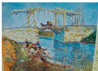
圖6：〈安格羅瓦橋〉畫作立牌