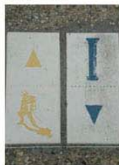
圖1：梵谷足跡之旅的指示磚

阿爾小鎮的梵谷足跡之旅，約由十幅梵谷畫作場景所組成，大概有<黃色小屋>、<隆河的星空>、<頂奎特爾橋>、<羅馬人石棺>、<阿爾療養院的庭園>、<石屋>、<夜間咖啡館>、<阿爾公園的入口>、<安格羅瓦橋>等，採用這幾幅作品畫面裡的場景，於原地立上畫作，且立畫作的位置還精準的依當時梵谷作畫之視覺角度，設置作品看牌，希望來訪的粉絲也能自己站在當年梵谷架畫架作畫的位置，在實景與畫作相對應下，看看梵谷如何將實景透過他燃燒的靈魂，轉化成畫作；此外，粉絲也能透過立畫的位置想像當年梵谷在此作畫的情景，想像梵谷揮舞著畫筆，或者仰望天空，又或者蹣跚步行的模樣，來一趟穿越時空之旅。作品與作品間，如何連繫，全靠設計精良的指引步磚，如圖1，朝聖者只要順著地上指示磚的方向漫步，既能找到下一幅畫作的景點，也能想像與梵谷同行，走在阿爾的小徑上。阿爾不僅只有梵谷的文化資產，也有古羅馬人遺留下來的龐大資產，因此圖1的地磚另一塊藍色的指示磚，便是走訪古羅馬遺跡的路線。這一塊梵谷足跡之旅的指示磚，採用白底搭配黃色梵谷身影的標誌，完全配合梵谷喜歡黃色的個性，譬如梵谷畫作<向日葵>，又譬如<黃色小屋>、麥田系列的畫作、<夜間咖啡館> 等等，梵谷都大膽的採用黃色作為畫面的主體。因此這片梵谷足跡之旅的指示磚，一是作為標誌的圖示，使用梵谷身影，有讓人一目了然的效果；二又能表現梵谷喜愛的黃色，因此阿爾梵谷足跡之旅的指示磚，可說頗具巧思。