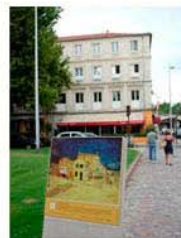
圖2：阿爾的黃色小屋場景