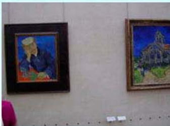
圖17：奧塞裡的〈嘉舍醫生〉與〈奧維教堂〉

奧塞美術館收藏梵谷畫作的數量，雖然不如荷蘭兩大美術館，但是件件是經典，都是初學者所認識的畫作，而且多以阿爾、聖瑞米與奧維時期的作品為主，強烈的主打梵谷最燦爛的時光與終留在法國的意象；如奧維時期有最重要的〈奧維教堂〉與〈嘉舍醫生〉(圖17)等畫作，聖瑞米時期則有〈午睡〉(圖18)與自畫像(圖19)等等，阿爾時期則有〈隆河的星空〉(圖20)與〈黃色小屋的內部〉(圖21) 6 等等。