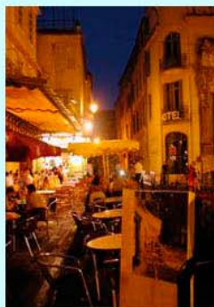
圖4：晚上的〈夜間咖啡館〉場景

梵谷畫筆下的阿爾咖啡館入夜的星空顏色為深藍色，圖4實景的夜空也為深藍色，這種深藍是剛入夜的顏色，隨著夜越深，夜空的顏色也越深，終至變成烏漆，想必梵谷喜歡這樣剛入夜迷人的星空，他在聖瑞米療養時期著名的〈星空〉與此次來台展出的〈普羅旺斯夜間的鄉村路〉，都是這樣的深藍夜空。這幅〈夜間咖啡館〉的主角咖啡館，據說原本並非黃色外觀，都因梵谷變成了黃色的外觀，店名也變成了「梵谷咖啡館」。這幅畫就是此次提供梵谷展的庫勒穆勒美術館的重要館藏，未能來台展出，難怪有許多喜愛梵谷的粉絲抱怨連連。