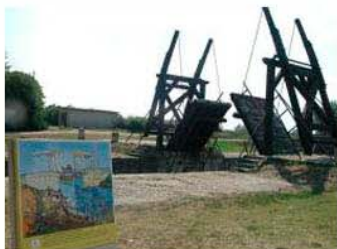
圖5：〈安格羅瓦橋〉的場景

另一幅庫勒穆勒美術館重要館藏〈安格羅瓦橋〉，也未來台共襄盛舉。這座橋位於阿爾市西南方，早在1926年被砲火摧毀，阿爾官方後來將橋的位置往市區移動重建，讓觀光客憑弔。見圖5與圖6梵谷在畫裡還是慣用他所喜愛的黃色，梵谷自稱是金黃色的陽光灑在橋上的景象。據何上恭先生對於此圖的剖析，呈現安定的構圖與