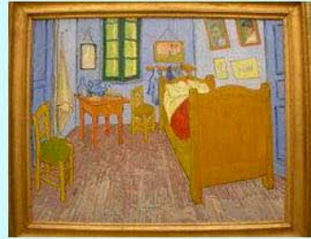
圖21：奧塞美術館裡的<黃色小屋內部>

假若梵谷在台灣，命運會怎樣？或許會被政治所淹沒了。當面對2009年金融海嘯時期，各國政府都祭出許多解救方案，但是法國總統薩科奇的方案則是砸350億打造「大巴黎」，重點在於大規模的都市更新計畫，以重塑巴黎的城市面貌。薩科奇也表示在任內要為巴黎留下大型工程與文化遺產，薩科奇這種想法其實是法國歷任總統的傳統，從龐畢度總統開始留下的是「龐畢度藝術中心」；季斯卡總統更敲定將火車站改為美術館的「奧塞美術館」；密特朗總統則大膽起用貝聿銘，以大羅浮計畫為羅浮宮增添玻璃金字塔；上一任總統希拉克則是興建以原住民藝術為主的「布利碼頭博物館」。可見法國的文化政策已實施久遠，也奠定良好的根基。因此我們看法國在規劃梵谷這位偉大畫家的政策與作法，從阿爾、聖瑞米、奧維到奧塞美術館的方式與堅持，的確讓我們與梵谷貼近了，也讓梵谷以另外一種形式留在人間。