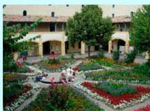
圖8：從二樓俯看阿爾療養院的庭園