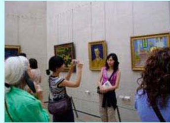
圖16：奧塞美術館與梵谷畫合照的粉絲

奧塞美術館收藏梵谷畫作的數量，雖然不如荷蘭兩大美術館，但是件件是經典，都是初學者所認識的畫作，而且多以阿爾、聖瑞米與奧維時期的作品為主，強烈的主打梵谷最燦爛的時光與終留在法國的意象；如奧維時期有最重要的〈奧維教堂〉與〈嘉舍醫生〉(圖17)等畫作，聖瑞米時期則有〈午睡〉(圖18)與自畫像(圖19)等等，阿爾時期則有〈隆河的星空〉(圖20)與〈黃色小屋的內部〉(圖21) 6 等等。