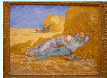
圖18：奧塞美術館裡的〈午睡〉