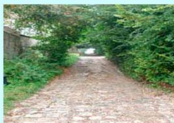
圖12：通往自殺地點的秘徑