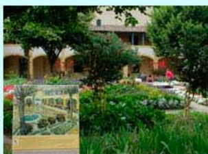
圖7：〈阿爾療養院的庭園〉立牌與實景

在阿爾的梵谷與高更起了衝突，而有了割耳事件，事後，梵谷被送進精神療養院，梵谷的世界從整個阿爾小鎮被壓擠成一個小小療養院，他所能畫的對象，也只有療養院的世界，他每天能透透氣的地方可能只有療養院的花園，因此〈阿爾療養院的庭園〉(圖7與圖8)的作品就是這樣完成的。看看圖9所立圖版畫面裡的景象，梵谷眼中的庭院是蕭瑟的、無生氣的，應是他當時的心情寫照。這間療養院也在二次世界大戰中毀壞，法國政府是依照這幅〈阿爾療養院的庭園〉重建的，且在1989改為文化與藝術中心，以紀念梵谷，阿爾人對梵谷的敬重與用心，或者說懺悔， 3 由阿爾療養院的重建並作為文化與藝術中心一事，表露無遺。