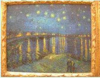
圖20：奧塞美術館裡的<隆河的星空>