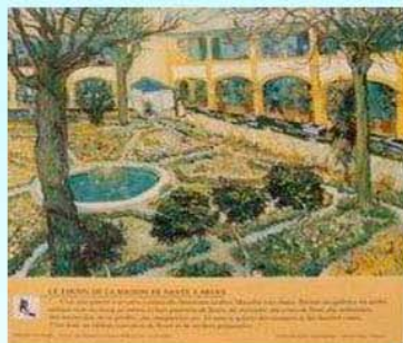
圖9：〈阿爾療養院的庭園〉的立牌

梵谷離開阿爾後，被送到附近更小的的小鎮聖瑞米裡的療養院，梵谷在此所留下的作品幾乎為田園景色，可說明小鎮的偏遠。梵谷在此待了約一年(1889.5-1890.5)，聖瑞米小鎮對於梵谷的畫作景點處理，類似阿爾，因為多為田園風光，要於畫作的景點立牌，困難度較高。因此我們跳過聖瑞米直接來到梵谷生命最後的二個月，奧維小鎮時期(1890.5-1890.7)，當然在此時期梵谷重要畫作的場景，都可在這個巴黎近郊的小鎮偶遇，而且當初他的住處現在也改成梵谷之家。把時光倒回到梵谷自殺前的時刻，梵谷走出住處往他熟悉的小徑漫步，應該是來到他每天必經的奧維教堂，(圖10與圖11)或許當天梵谷有走進教堂祈禱了什麼?總之，離開教堂穿越寧靜的