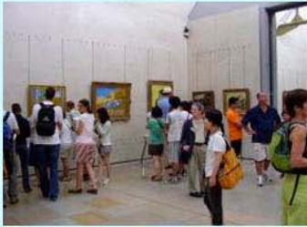
圖15：奧塞美術館的梵谷展區

梵谷幾乎把他人生最燦爛的時間給了法國，梵谷跌跌撞撞摸索的人生階段 5 ，則是他還待在母國荷蘭的時候，終其一生他未再回到荷蘭，幸而荷蘭拼了命收藏他的畫作，有兩大美術館並列世界之最。那麼法國呢？以收藏近代藝術品著名的奧塞美術館，則有梵谷經典之作的收藏。奧塞美術館是世界印象派作品的收藏中心，有專屬印象派的展區，依印象派時期與各位大師的作品成立特區，梵谷就是被安排在印象派大師的特區裡，圖15為梵谷畫作專屬展區，圖16有絡繹不絕的粉絲與畫作合照。