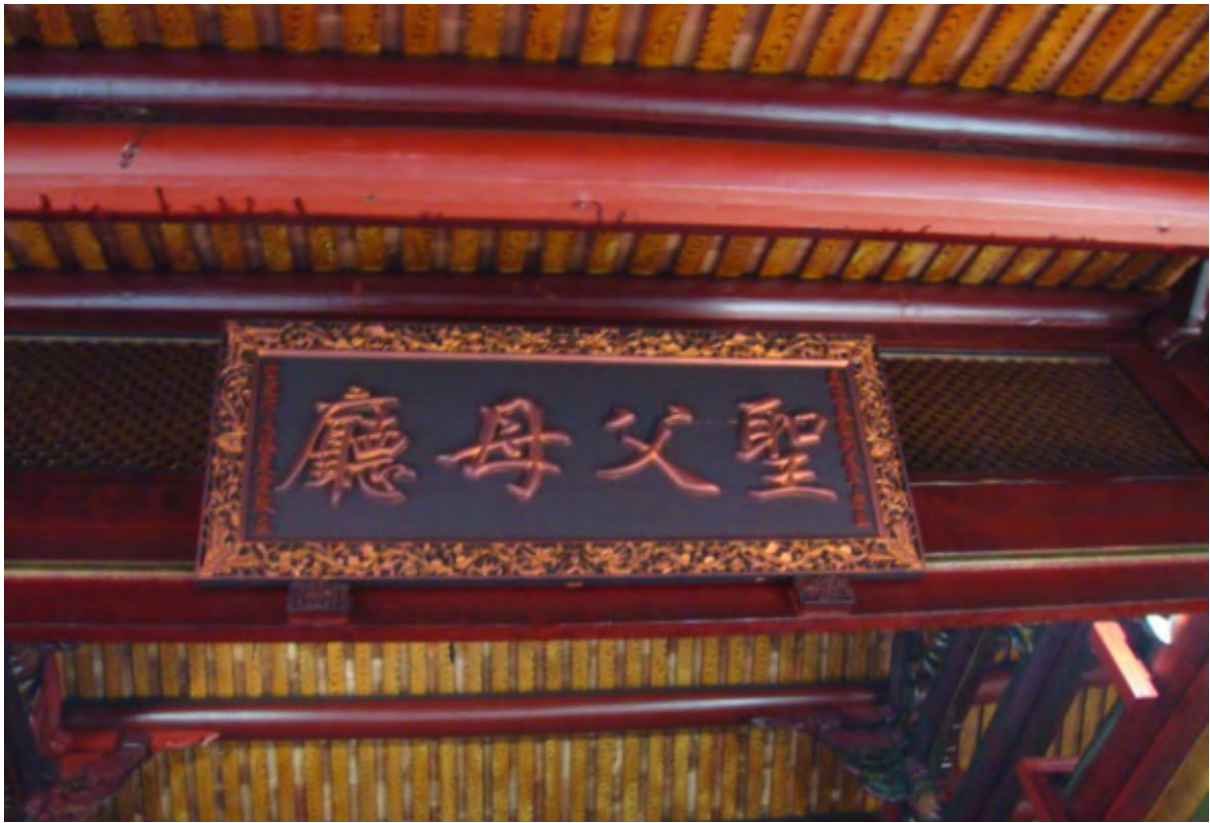
【圖片說明】聖父母廳：為什麼要拍這個，因為上面的樑就是寧靖王跟五個妃子自盡的樑，我覺得還挺有歷史性的。(拍照時間：4/11，14:37)

頭龍尾的精緻雕刻，是唯一台灣寺廟有雕刻的階梯，俗稱螭虎吞腳，我們可以清楚看見這些石雕都有些風化，兩旁的石獅是道光年間就雕刻留下的，再來的雕刻來是門上的雕刻有五隻蝙蝠雕圍繞四周刻意味著五福臨門，在來向上頭望去有兩個龍頭那稱為鰲頭，左右上頭都有很多精緻的雕刻，像是門簷，他是用來固定門柱穩住門扇的，雕刻成離虎的造型，再來我們發現兩偏門旁有兩個石頭由青斗石雕刻而成，那稱為印斗石也稱門枕，中間大門的石雕比較大顆叫石鼓也就是抱鼓石，這三個門口有甚麼不同呢？兩個偏門是普通民眾在走的，通常都是龍門進虎口出，而中間的大門則是大官或神明在走的，是不一樣的！