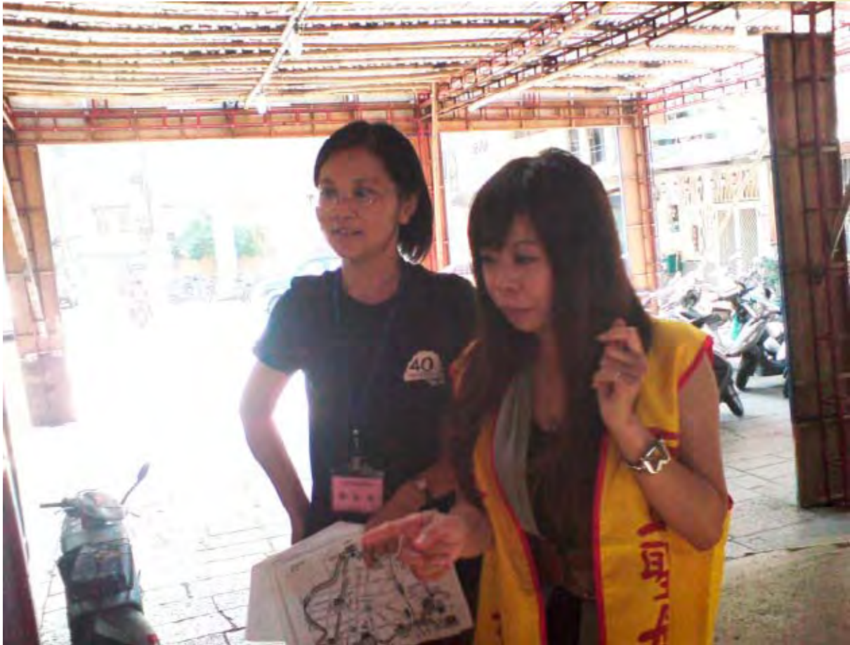
【圖片說明】三川門前：這是和老師講解的時候，一步一步來…。(拍照時間：5/16，14:29)

我們看著來來往往的遊客，我想他們最主要的目的就是來朝拜我們的媽祖娘娘，我問跟我同定點的夥伴，我們是不是該主動去問問他們是否需要介紹？就把這當作我們的作品介紹？他回答：跟作品又有些不同吧！產品是我們花一年去製作的，那種感覺一定不一樣的。我想那好吧！如果有人經過須要講解我們再開金口吧，這讓我覺得自己似乎不太敬業，哈哈！雖然實際行動真的大過心想得，我心裡是覺得，學習與服務並不是因為介紹甚麼東西而介紹，而是把這樣的一個態度或學習經驗轉換到另一個經驗上，簡單說，你只要把它當作你的產品一樣這樣的介紹，訓練你的膽量及親和力，試著對陌生人開口試著去講解不屬於你所製作的東西，這就是一種學習一種經驗，對我而言，我覺得很多很多的時刻或想法，多少都能給我一些感觸，即使不是自己是別人的事情，我很能去感覺。