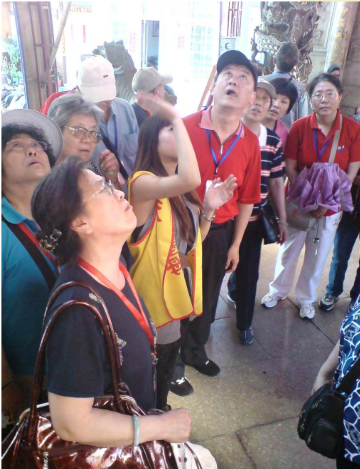
【圖片說明】三川門前：能替他們解說當然是我的榮幸，至少感覺有做到一些事情拉，還好解說員和導遊有替我在一旁解說，讓我完成這項介紹，感覺很親切呢！（拍照時間：5/16，15:45）