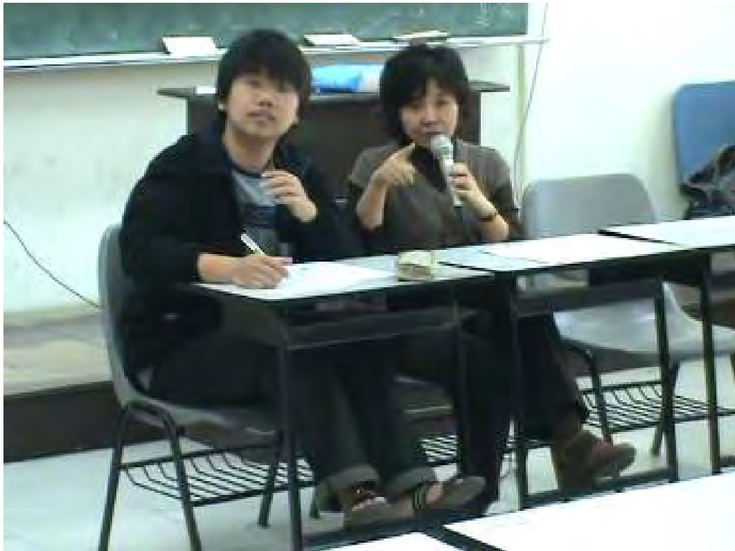
老師和班長共同主持座談會