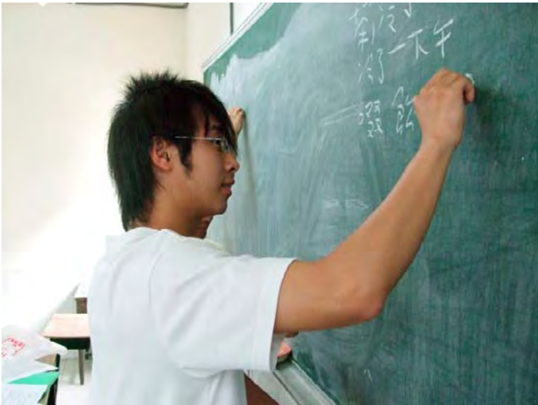
小詩拼圖成果發表