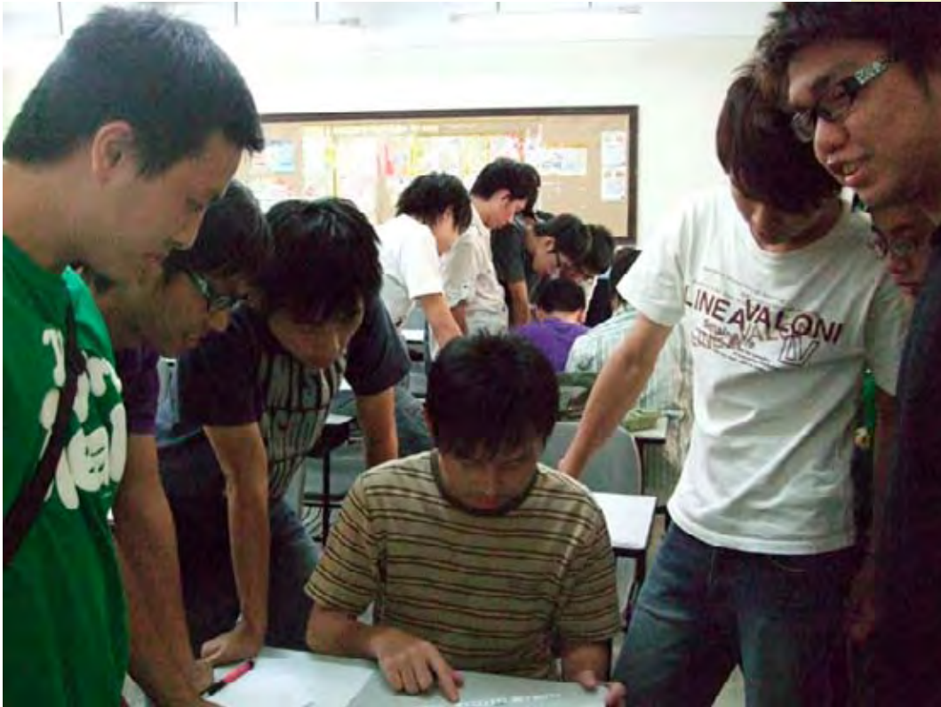
分組討論所抽到的小詩