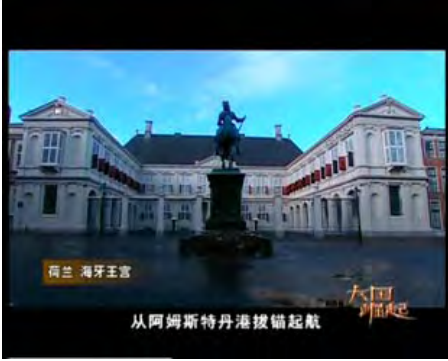
《大國崛起》電視紀錄片