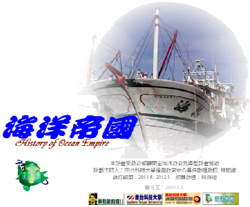
「海洋帝國」教學網站