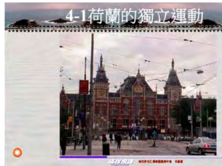
「海洋帝國」課程教材：《海洋帝國》教學投影片