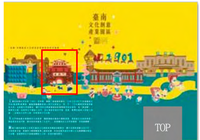
圖 5:畫有北門的 6 月 12 日啟用節目單的封面