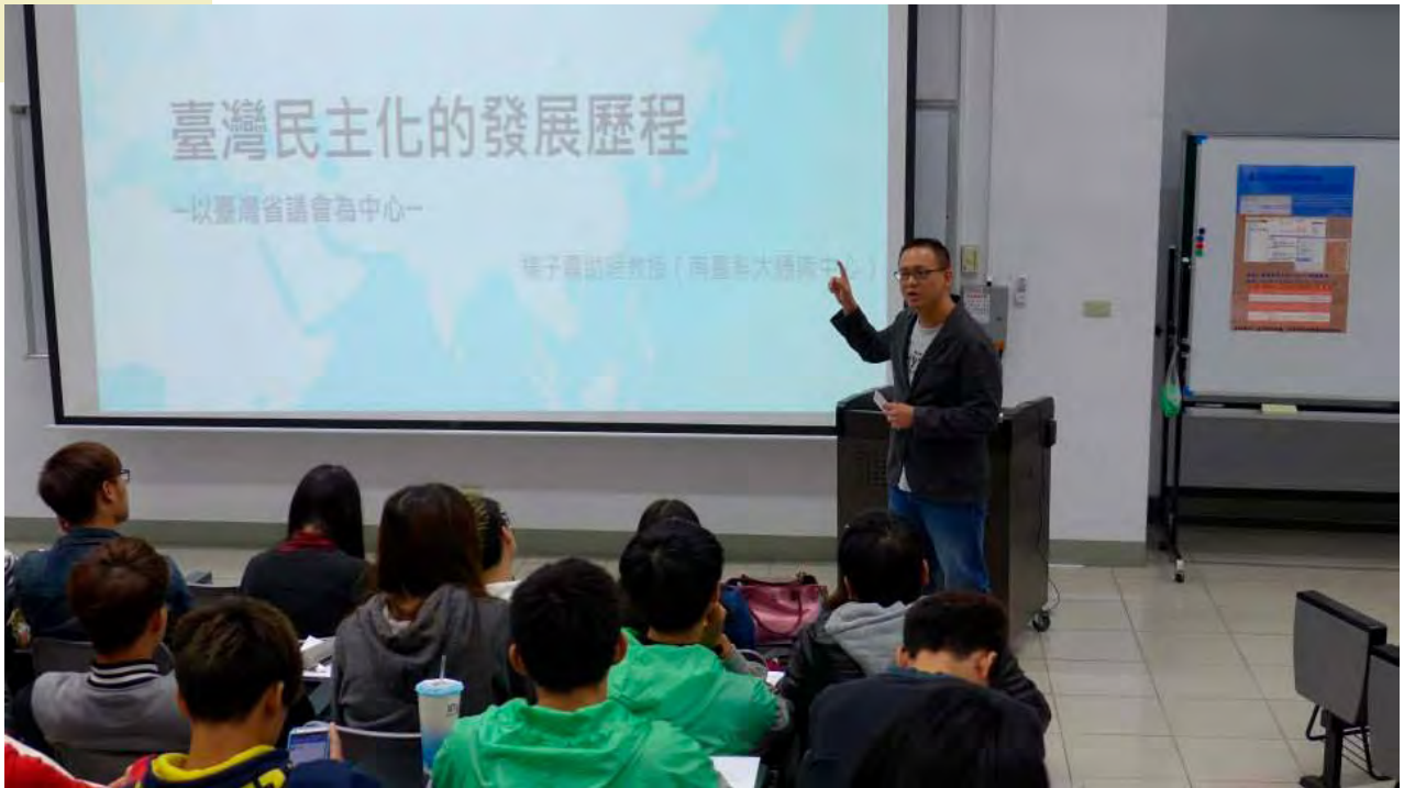
筆者專題演講：「臺灣民主化的發展歷程：以臺灣省議會為中心」