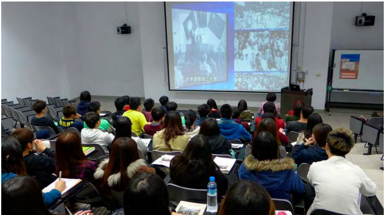
播放臺灣省議會歷史介紹影片