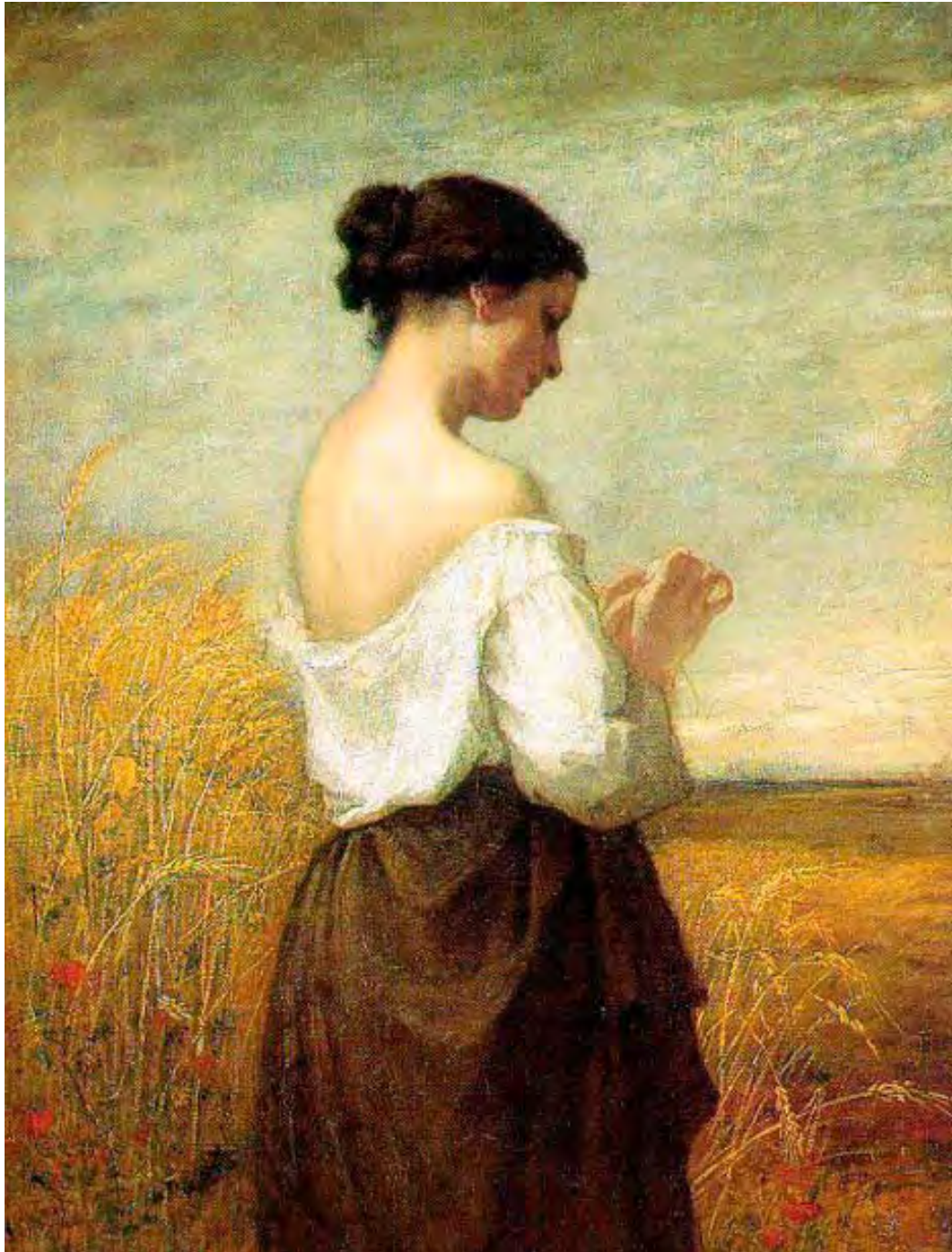
杭特(William Morris Hunt, 1824 –1879) 《農婦》(Paysanne, Musée d'Orsay, Paris)

物象、色彩、明暗建構對比的畫面，足以讓人深刻的體會那辛苦。而這正是觀看真實畫作的感動，《拾穗》複製品雖時可見到，但這細節的積累，方足以構築成完整作品，傳達對勞動者的敬意。