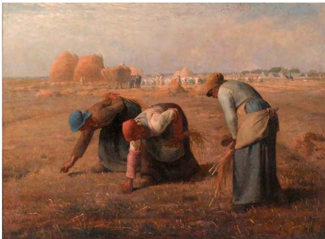
米葉(Jean-François Millet, 1814-1875) 《拾穗》(Des glaneuses, Musée d'Orsay, Paris) https://upload.wikimedia.org/wikipedia/commons/1/1f/Jean-Fran%C3%A7ois_Millet_-_Gleaners_-_Google_Art_Project_2.jpg

同樣是從學院派傳統的桎梏中跳脫，但印象派和象徵主義選擇的主題與方向便大不同，同一時期許多畫派林立，在在說明了創作的多元性，其甚至於大眾所熟悉的印象派，其實也有著許多不同的主題與詮釋方法，並非單一的光與快速筆觸而已。透過十九世紀後半藝術作品的並置，不僅看到發展的脈絡，更看到畫派間彼此的關聯，尤其同一畫家的作品出現在不同主題的展場，除了縱向發展的延續，亦可看到橫向的觸及，打破了畫派壁壘分明的想像，藝術創作者彼此之間的互動交流，在當時是頻繁的，藝文界的往來，帶動藝文發展與藝術市場，當然大時代的發展，無可避免的提供了相當的條件，種種條件配合下，造就美好年代(Belle Époque)。