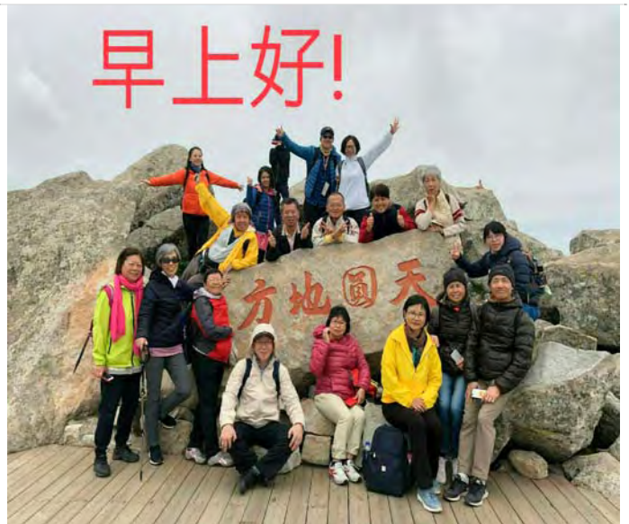
天圓地方·南北分界

回程往下步行近 2 小時至拂雲閣索道下山，沿途步道兩旁松林疊翠，奇花異草，遠觀遼闊山景，途中還可以看到山下蜿蜒曲折的盤山道和七女峰。6 點趕搭最後一班園區環保車下山，返回山下住宿的太白山御龍灣溫泉酒店。