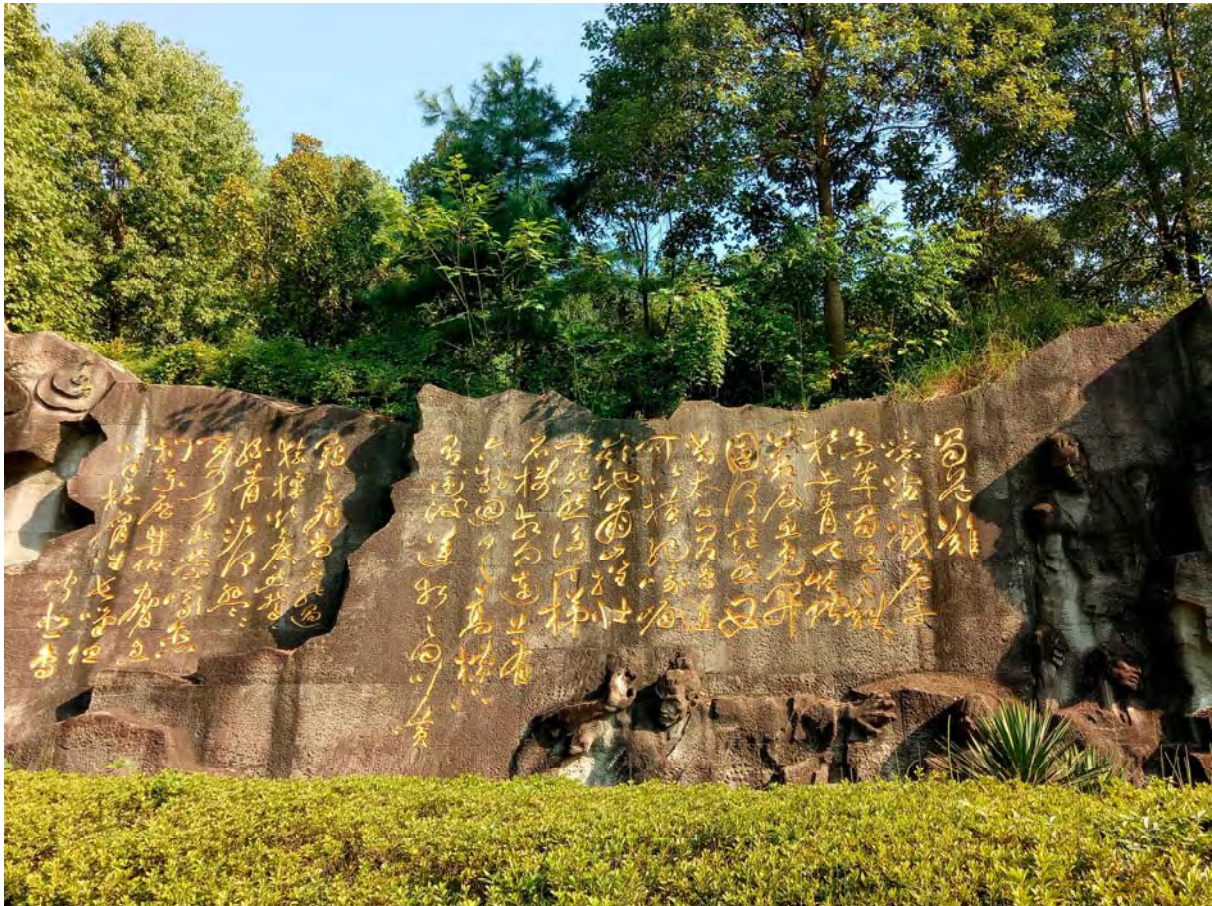
太白碑林〈蜀道難〉

花間一壺酒，獨酌無相親；舉杯邀明月，對影成三人。 月既不解飲，影徒隨我身；暫伴月將影，行樂須及春。 我歌月徘徊，我舞影零亂；醒時同交歡，醉後各分散。 永結無情遊，相期邈雲漢。