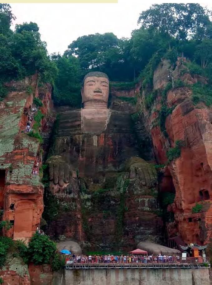
莊嚴的樂山大佛

下午 5 點 30 終於趕上最後一班樂山遊江的船班，建於唐代的樂山大佛臨岷江與大渡河、青衣江的匯流之處，背靠凌雲山西壁，大佛通高 71 公尺，是世界上最大的石造佛像。整個大佛比例勻稱，面相端莊，姿態雍容，氣魄雄偉。1996 年《峨嵋山樂山大佛》作為一項被列入《世界文化與自然雙重遺產》名錄。我站在船上拍下樂山大佛，真感動！過去在地理教科書上的記憶赫然顯現在眼前，寬闊的江面是三江匯流的奇景！船行漸遠遙望凌雲山水光山景則是一尊臥佛的莊嚴！