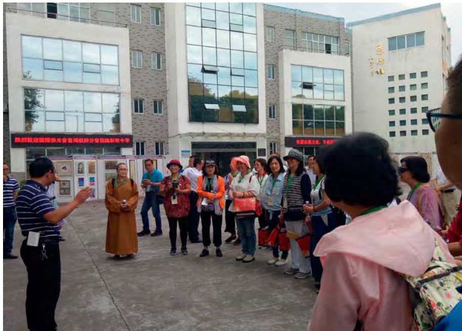
彰明中學 思源樓前

第一天下午2點多到成都機場後，就趕近3小時車程到江北江油市拜訪彰明中學。2008年四川省汶川縣發生大地震，國際佛光會在第一時間趕赴災區救災賑濟，並協助彰明中學修建教學樓和食堂等，讓學生得以繼續求學。彰明中學不忘恩情，2009年曾派師生代表團到台灣，進行感恩