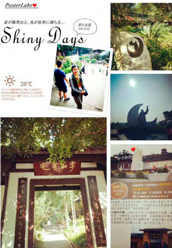
李白故居·舉杯邀月

在詩仙醉酒園，我特別逆光拍下「舉杯邀明月」的雕像，意境真美！想起李白的《月下獨酌》詩云：