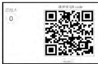
圖 2：掃描 QR code 進入即時回饋