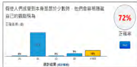
圖 3：Flip 答題統計