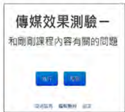
圖 1：即時回饋控制台

課堂中使用即時回饋功能 (圖 1)，讓同學透過手機掃描 QR code (圖 2)進行作答，答題完成後，教師可以立刻透過統計結果，確認學生的答題狀況以及正確率(圖 3)。