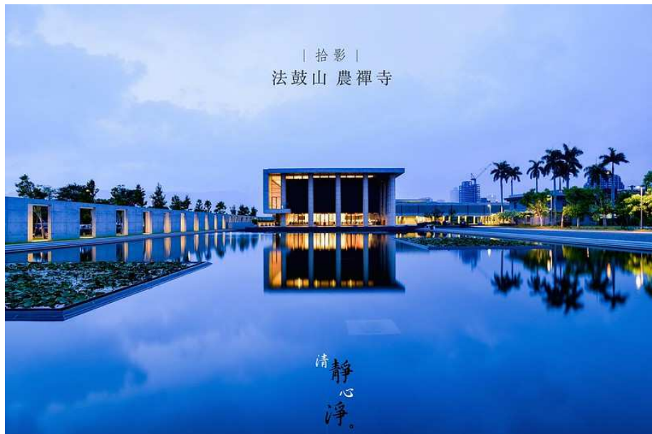
拾影 | 法鼓山 農禪寺

1971年，東初老人於關渡平原興建一棟兩層樓農舍，將之命名為「農禪寺」。1978年，聖嚴法師接任住持，一步步興辦現代化的佛法弘化事業。數十年來，小小農禪寺延展出層層鐵皮屋，成為現代人心靈的一方淨土，並孕育出樸實的法鼓山宗脈。十方信眾求法心切，希望發展一座現代化道場，於是歷經兩年整建，農禪寺水月道場終於2012年12月29日落成啟用。一方水池，映照大千，農禪寺蛻變成一座即景觀心的景觀道場，繼續引領大眾培福修慧、安頓身心。