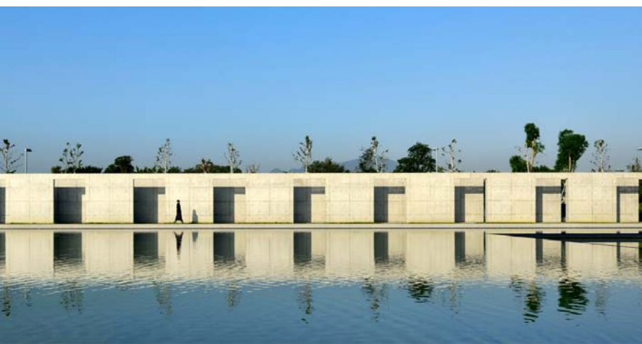
長連廊（引自姚仁喜大元建築工廠）

看到水月道場使我聯想到雲門的作品「水月」，「水月」創作於1998年，汲取偈語「鏡花水月畢竟總成空」的靈感，根據「太極導引」為動作基礎發展成形。舞台上流水潺潺，明鏡輝映，舞臺上鏡子倒映舞者身影，與實際的舞者相輝映。有虛幻與現實交錯的感覺，符合鏡中花、水中月「鏡花水月」的美感。