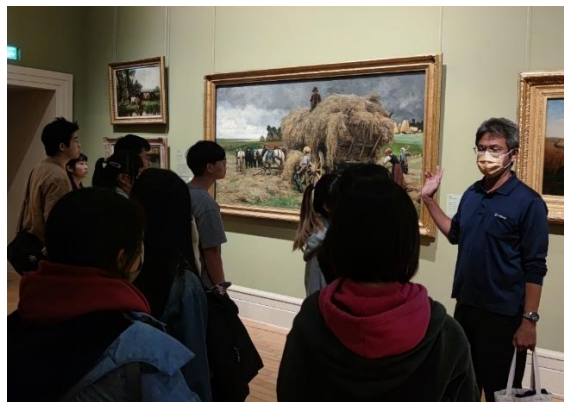
【圖 4】朱利安·杜培的作品「豐收」(The Hay Harvest)