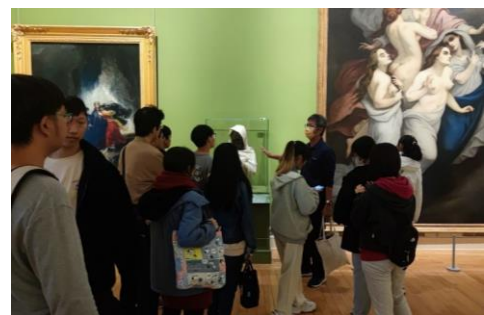
【圖 1】皮耶多·卡羅的作品奧賽羅(Othello)雕像 【圖 2】講解奧賽羅故事