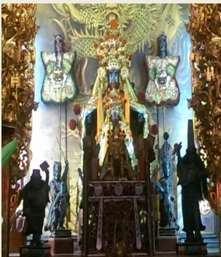
李府千歲暨范、謝將軍