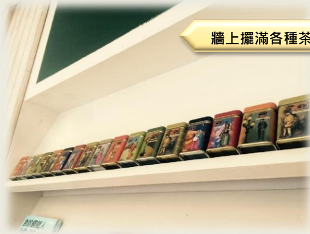
牆上擺滿各種茶罐，每個罐子都非常精美

再來一看菜單上的食物名稱，除了被價錢所嚇到以外，令我覺得新奇好玩的事物擇時每道菜的名稱，其中：撫慰人心的奶茶令我好奇，我一問老闆，原來這是當他們非常辛苦工作一整天時，他們其實漬劑也懶得泡茶所以就想隨便喝個