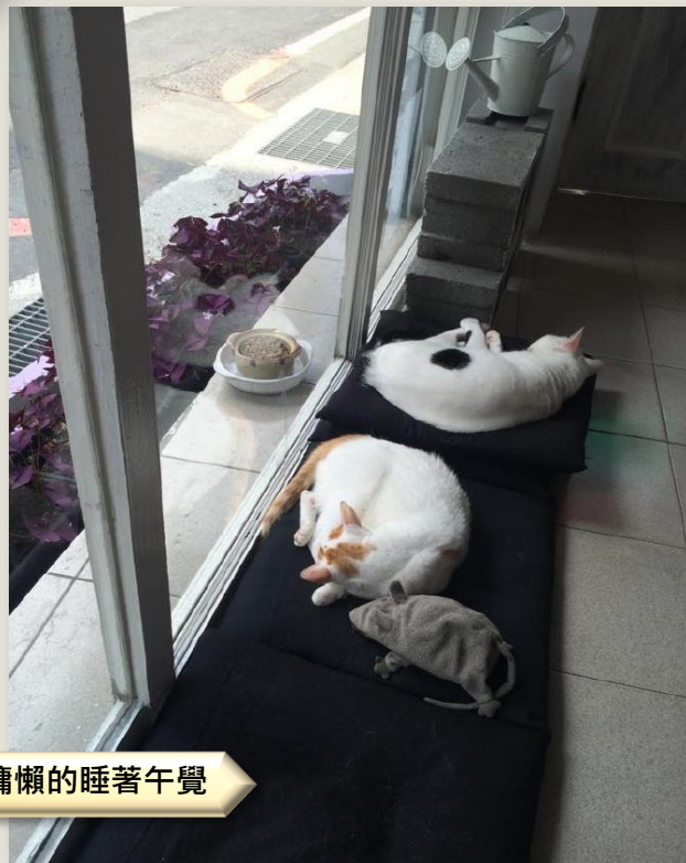
老闆飼養的貓咪，在店內慵懶的睡著午覺

身為設計系的學生在大家很閒的時候，我們就需要做一大堆作品、報告、討論、不停地畫，有時候真的是要看著日出完成作業。大家每天都在為作業忙碌，所以當聽完這個奶茶的名稱由來，我和我朋友一致認為這真是設計人所需要的東西，由其在做的東西被老師砲轟回來之後，真的需要一個撫慰人心的東西，一句話也好，就是。沒關係啦要加油喔。