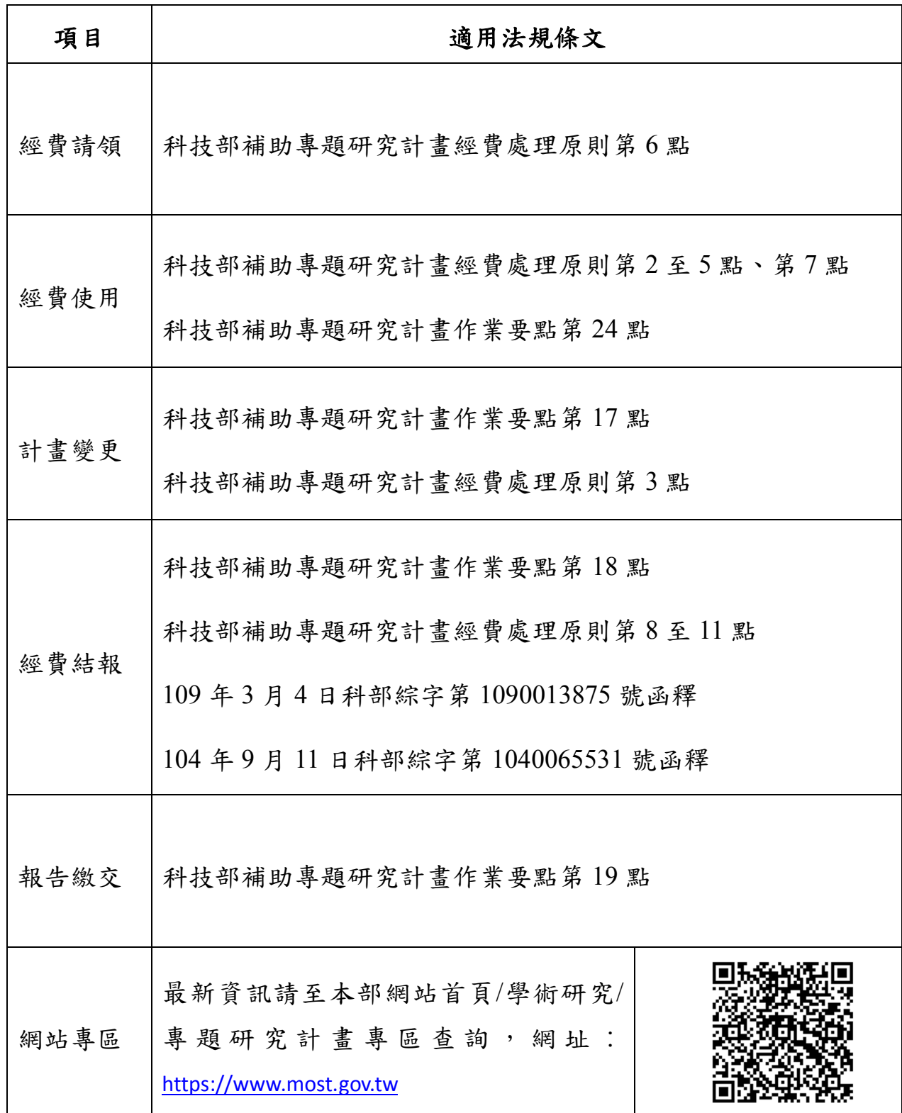
附表 科技部補助專題研究計畫相關規定